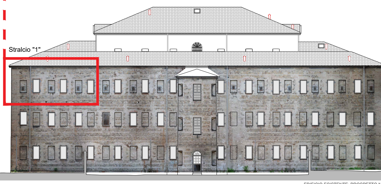
EDIFICIO ESISTENTE - PROSPETTO NORD

Art. 3.2.31 (Comma 6) Per gli edifici soggetti a "restauro scientifico" e a "restauro e risanamento conservativo", nei confronti dei quali l'impossibilità di aprire nuove aperture nei prospetti o la presenza di portici o logge impediscano il corretto raggiungimento del rapporto illuminante pari a 1/8, è ammesso il mantenimento del rapporto illuminante in essere o il suo miglioramento, anche in caso di cambio di destinazione d'uso, alla condizione che la superficie in oggetto, in sede di primo accatastamento, costituisca superficie utile (sono quindi esclusi cambi d'uso e recuperi di superficie utile di locali pertinenziali, quali ad esempio magazzino, deposito, cantina, rimessa). E' invece ammesso il recupero di locali pertinenziali per gli usi commerciali e terziari, nel rispetto dei requisiti prestazionali relativi ai luoghi di lavoro.